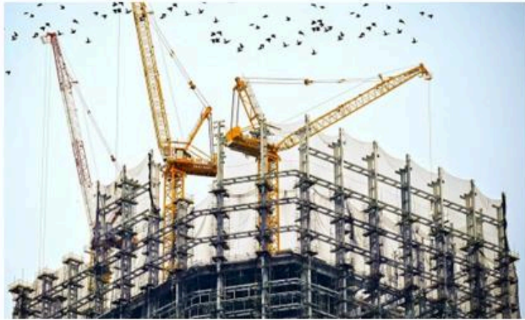
PARCOURS 'DISCIPLES AU TRAVAIL'