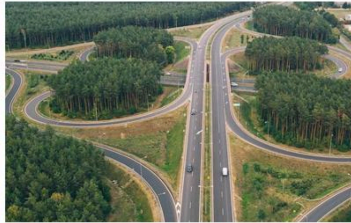
PARCOURS 'ORIENTATION PRO'